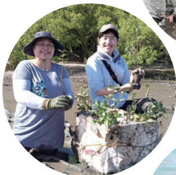
(特非)イカオ・アコ