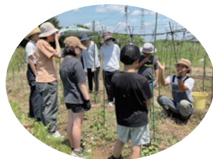
環境教育 第35回助成先 NPO法人ふるさとファーマーズ