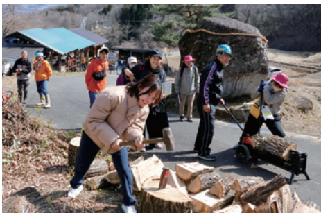
「里山体験エコツアー」 第34回助成先 (特非) 里山環境さなざわ