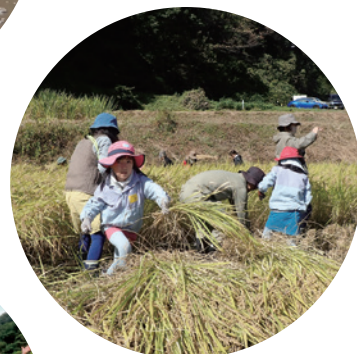
(特非)里山環境さなざわ