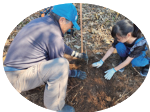
植樹活動 第35回助成先 (特非) 白神ネイチャー協会