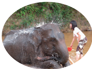
野生動物の保護 第35回助成先 (一社) Hidamari