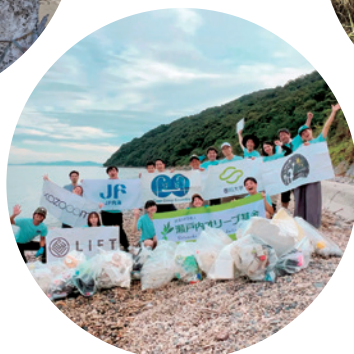
(特非)クリーンオーシャンアンサンブル