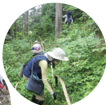
里山の山野草を守る会