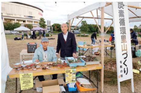
「アースデイ幕張」 第34回助成先 NPO団体令和の杜